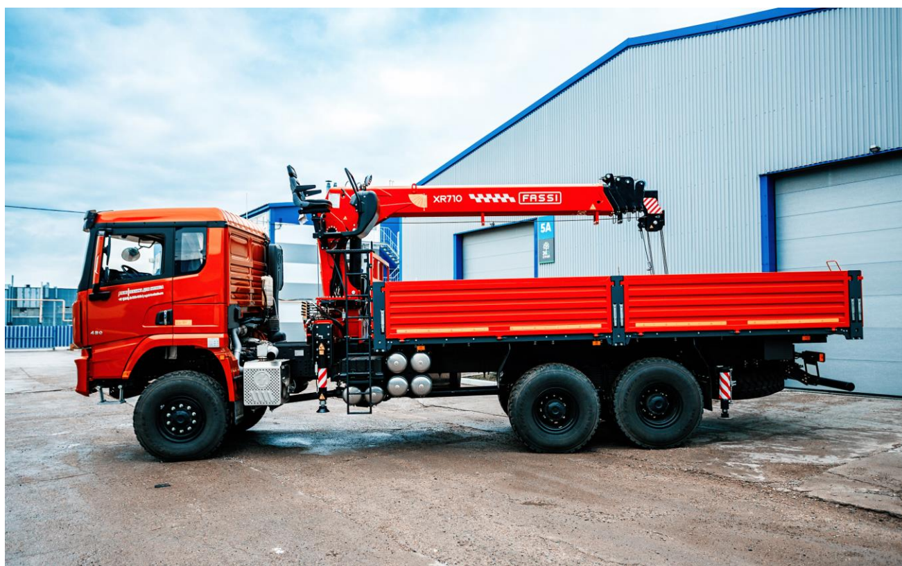
FAW CA3250 с КМУ FASSI XR716 (Малайзия).

ООО «А1 Машинери» является поставщиком строительной техники и оборудования. Предлагаем к поставке: